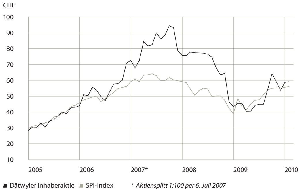
Kursentwicklung Dätwyler Inhaberaktie (im Vergleich zum SPI-Index; Basis: Höchstwerte pro Monat)