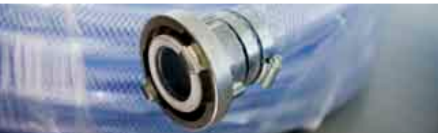
In der Fluidtechnik ist Maagtechnic ein anerkannter Partner von Industrie und Gewerbe.