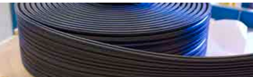
Im Hoch- und Tiefbau steht Dätwyler Rubber für hochwertige Spezialprofile.

Dätwyler hat per 31.12.2009 keine Anlehensobligationen oder Wandelanleihen ausstehend.