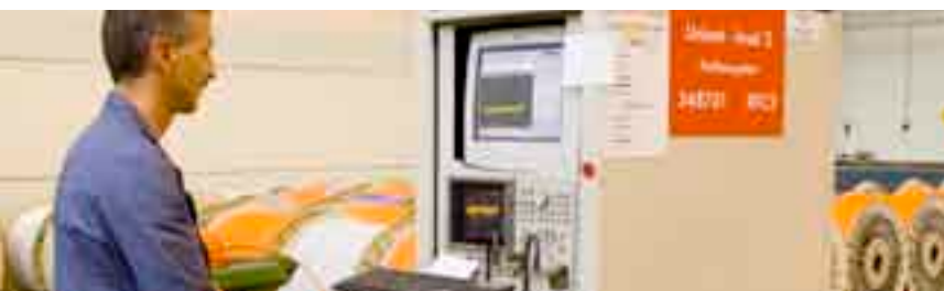
Mit standardisierten Prüfverfahren garantiert Dätwyler Cables höchste Qualität.